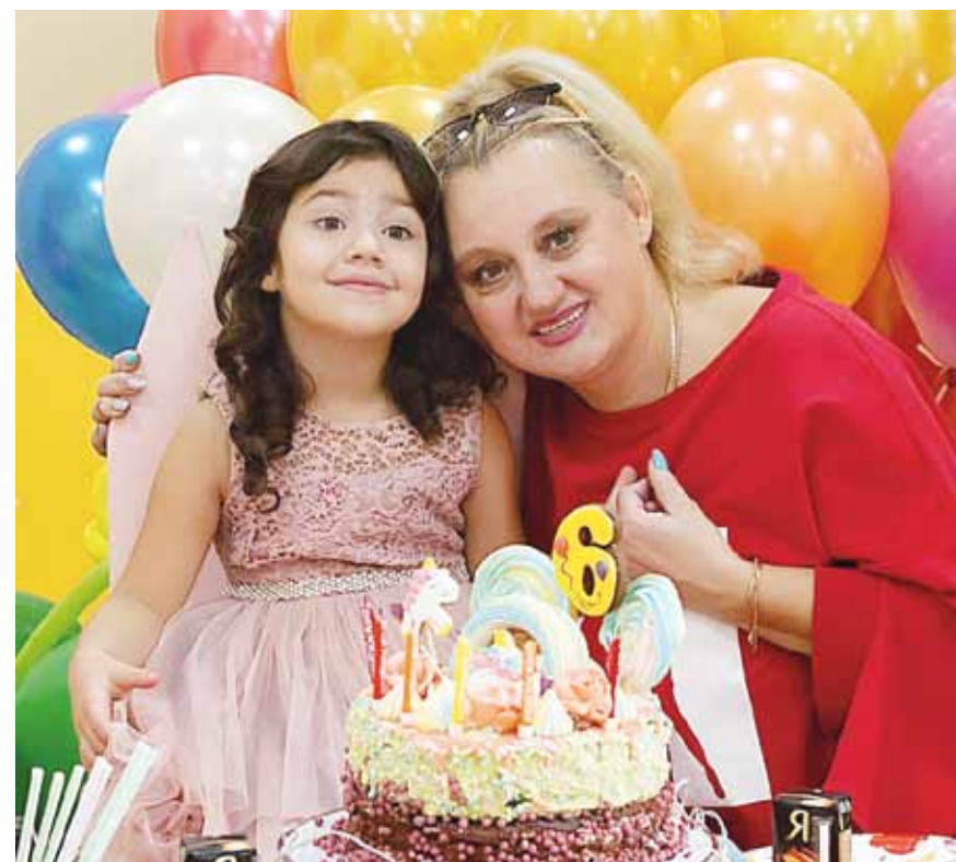
▲ Семья — это главное.

— Будьте готовы к полной самоотдаче. Чтобы бизнес был успешным, им нужно жить. Относитесь к нему не как к работе, а как к стилю жизни. Нужно развиваться, исправлять ошибки, идти дальше, не останавливаться. Но при этом и бережно относиться к себе, провести диагностику собственных сил. Желание — это хорошо, но для движения вперёд нужны ещё и ресурсы.