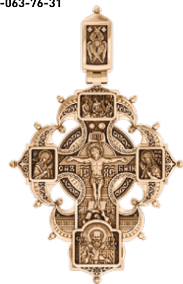
▲ Мужские коллекции из золота, изделия из серебра с золотым покрытием.