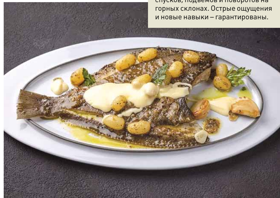
▲ Рыба на столы попадает прямо с рыболовецких судов в Баренцевом море.

Здесь посетителям предлагают местную аутентичную кухню, в которой особая роль отведена блюдам из разнообразной морской рыбы и морепродуктов. Морские гребешки, полярные кре-