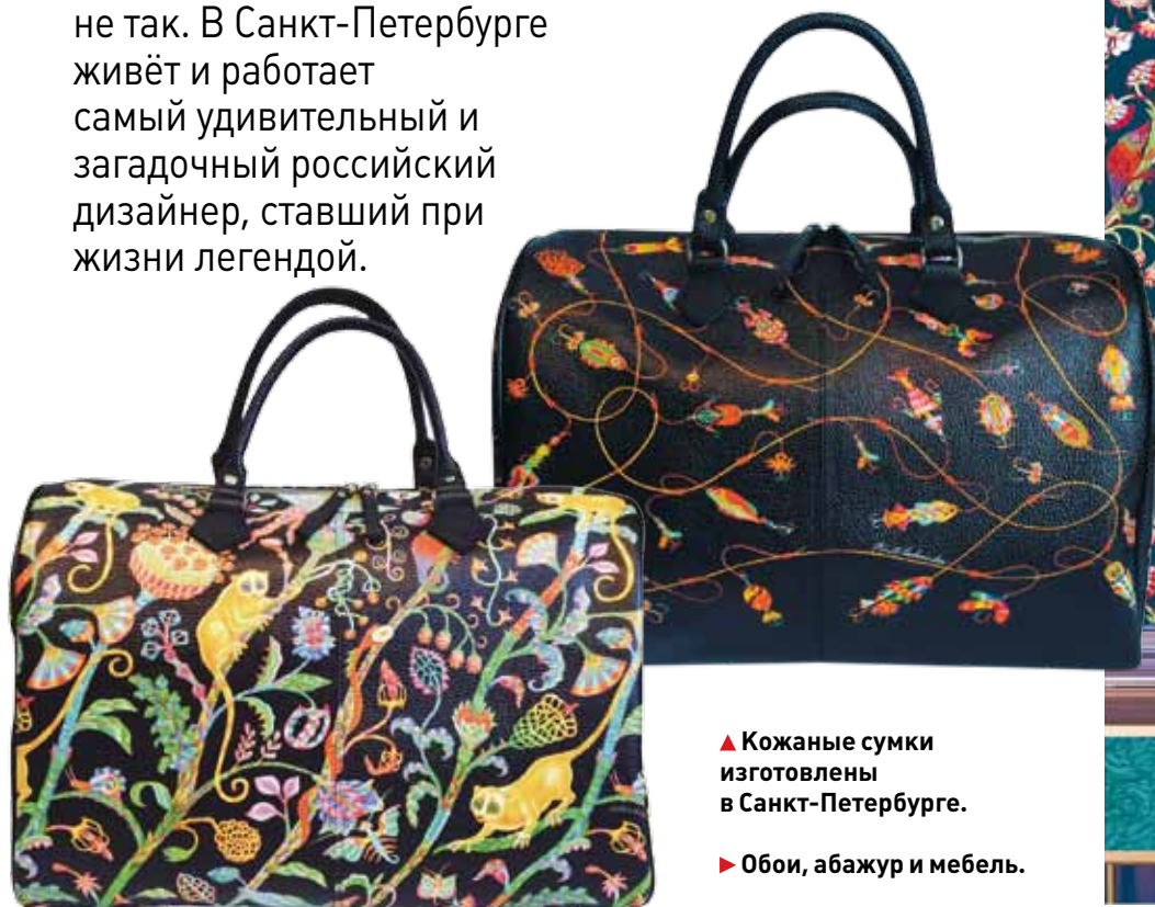
▲ Кожаные сумки изготовлены в Санкт-Петербурге.

Мы привыкли, что уникальные дизайнеры и люксовые бренды существуют где-то там – в Европе, Америке... Но это не так. В Санкт-Петербурге живёт и работает самый удивительный и загадочный российский дизайнер, ставший при жизни легендой.