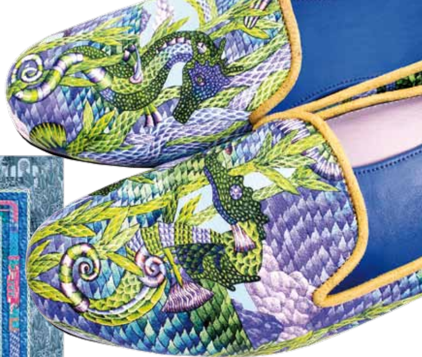
▲ Кожаная обувь.