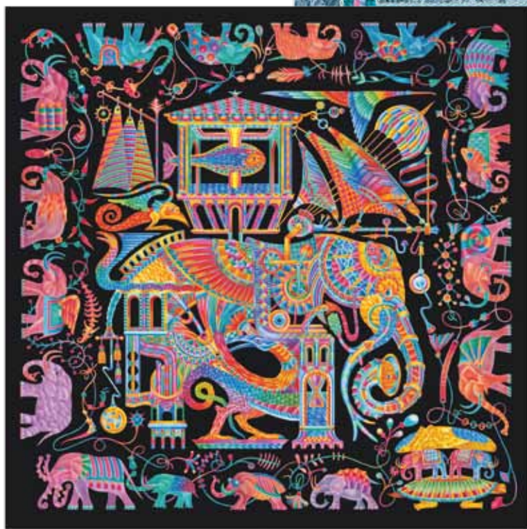
▲ Шёлковые платки и декоративная подушка.

В 2021 году совместно с Императорским фарфоровым заводом была создана коллекция фарфора «Ля-муррия». Великолепные чайные пары и шкатулки выделяются ярким и необычным дизайном.