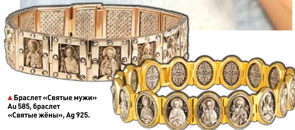
▲ Браслет «Святые мужи» Au 585, браслет «Святые жёны», Ag 925.