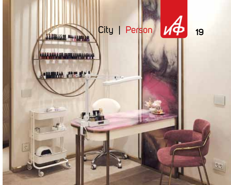
▲ Здесь предлагают полный спектр услуг.

◀ В клубе царит атмосфера комфорта и спокойствия.