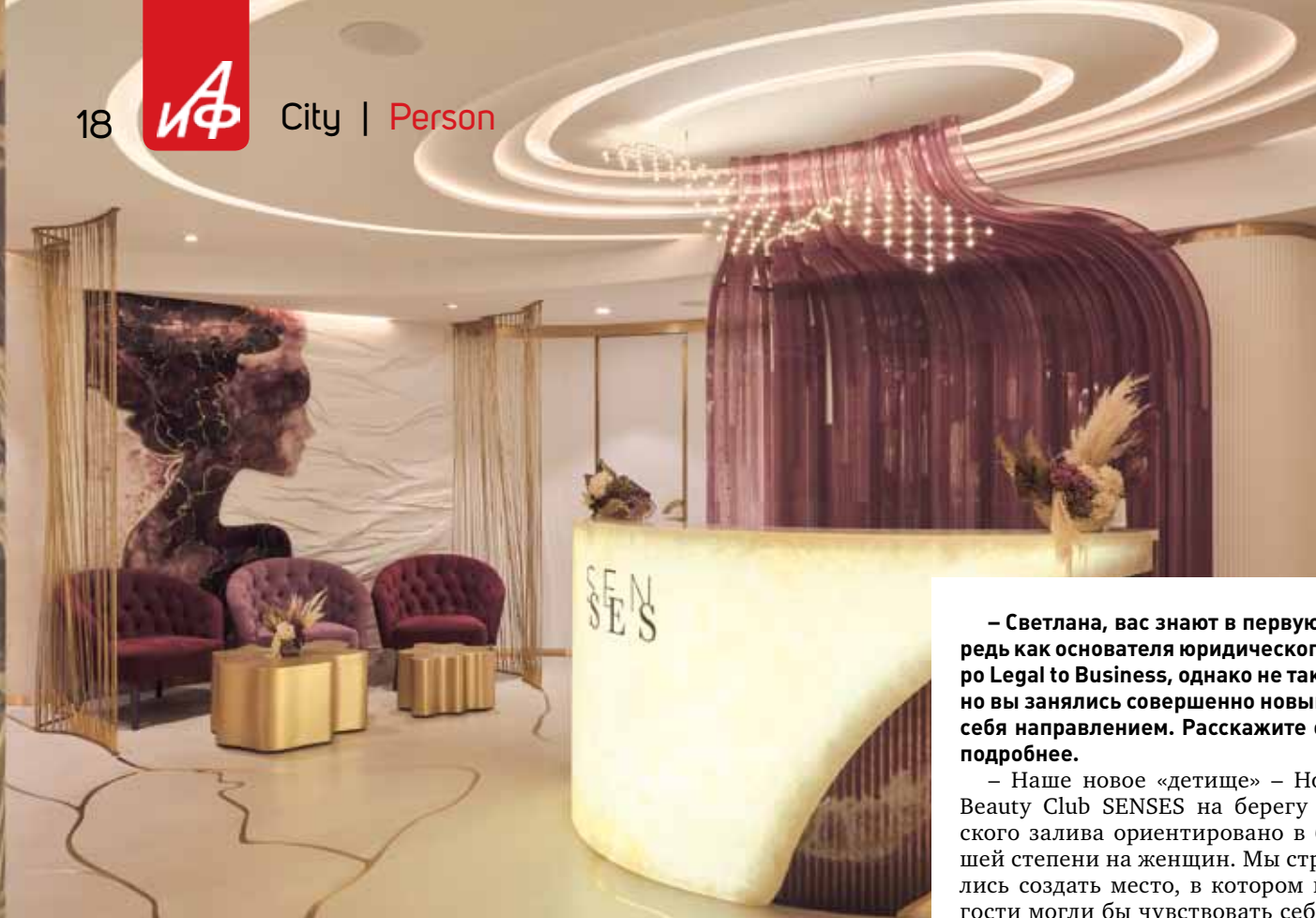
▲ Место, в котором гости чувствуют себя как дома.